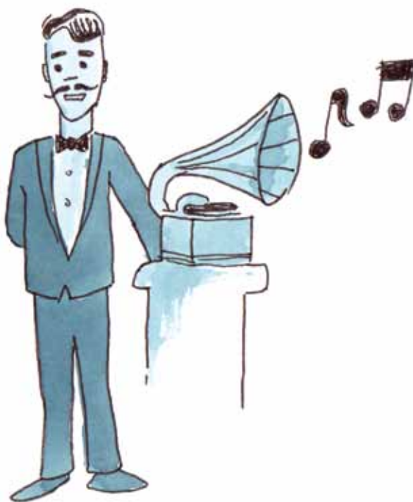
Illustration: Søren Amstrup

Her kom Frivilligcenter SR-Bistand på banen for første gang. Grundlaget for vores frivilligcenter blev skabt, da en gruppe socialrådgivere, i forbindelse med vedtagelsen af Bistandsloven i 1975, dannede en "alternativ socialrådgivning". Hos os kunne borgere søge hjælp, hvis de følte sig uretfærdigt behandlet i det offentlige system, der med Bistandsloven fik adgang til at udmåle hjælp individuelt og ikke kun takstmæssigt.